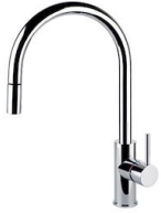
Mitigeur Camillo 8467 000